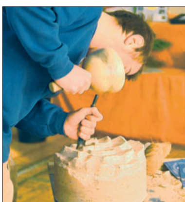
Konzentriert bei der Arbeit – und beim fröhlichen Messeplausch.