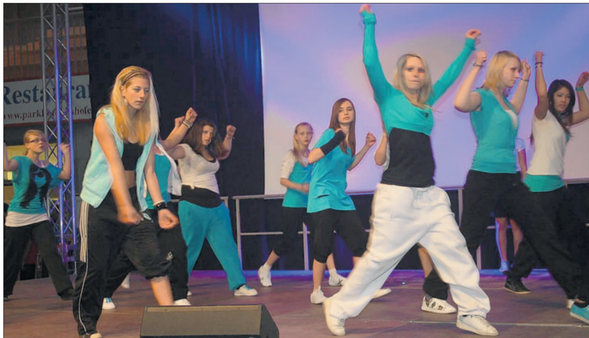
Plattform für den Nachwuchs: Auf der Arena-Messe zeigen viele regionale Vereine und junge Talente ihr Können vor einem größeren Publikum. Im Bild die Hip-Hop- und Salsa-Show der Pasión Tanz Lounge.