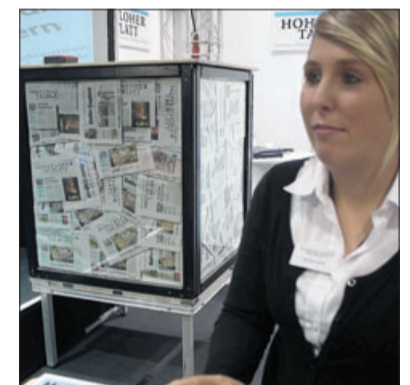
Die Gewinner des HT-Schätzspiels werden noch ermittelt.

Link-Events Als Nächstes plant der umtriebige Messemacher aus Schwaigern die „Handwerk 2011“ in Schwäbisch Hall vom 8. bis 10. April; eine weitere große Regionalmesse wird die „2. TBB“ in Tauberbischofsheim (1. bis 5. Juni) werden; im Herbst gibt es dann die zweite Auflage der Messe „Bauen“ in Crailsheim. res